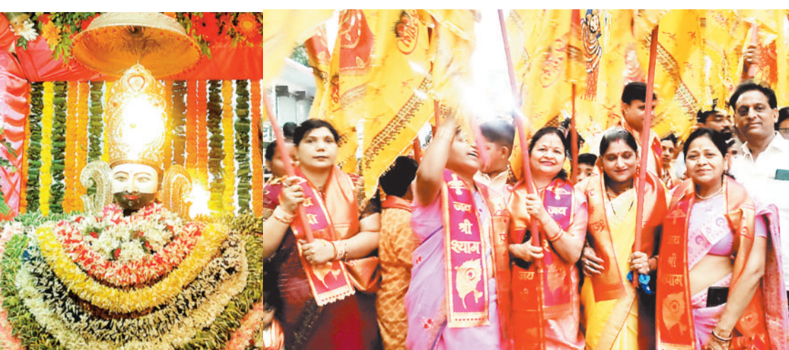
आयोजित वार्षिकोत्सव कार्यक्रम में उपस्थित महिला श्रद्धालु।