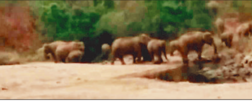
नदी किनारे विचरण करता हाथियों का दल।

प्रतापपुर वन परिक्षेत्र अंतर्गत ग्रामीण क्षेत्र में 40 हथियों का दल पहुंच जाने से ग्रामीणों में दहशत का माहौल है। दल में नर एवं मादा हाथी सहित शावक हाथी हैं। हथियों के दल के गांव के समीप नदी किनारे पहुंच जाने से ग्रामीण भयभीत हैं। हथियों का दल करंजवार, सरहरी, घरहरी, खुरमा सीमावर्ती क्षेत्र के जंगलों में देखा गया है तथा हाथी पानी के लिए जंगल से निकल कर नदियों की तरफ पहुंच रहे हैं। इस भीषण गर्मी में जहां पानी की तलाश में हिरण कोटरा सहित अन्य छोटे जानवर जंगल से निकल बस्ती की ओर पहुंच जाते हैं। जंगल से