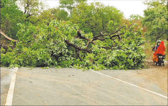
सड़क पर गिरा पेड़।