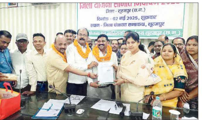
निर्वाचित अध्यक्ष को प्रमाण पत्र देते अधिकारी।