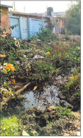
गंदगी का अंबार।

स्थानीय प्रशासन की अनदेखी से बढ़ रहा बीमारियों का खतरा वेस्ट चिरमिरी। क्षेत्र इन दिनों गंदगी के चलते नारकीय स्थिति में तब्दील हो चुका है। चारों ओर फैली गंदगी, जाम नालियां और बारिश का गंदा पानी लोगों के घरों में घुसना आम बात हो गई है, इसके बावजूद नगर पालिक निगम चिरमिरी और एसईसीएल दोनों ही जिम्मेदार संस्थाएं आंखें मूंदे बैठी हैं। नगर निगम के पास सफाई के लिए नियुक्त अमला क्षेत्र में नाम मात्र की भी स्वच्छता नहीं कर पा रहा है। वहीं एसईसीएल द्वारा करोड़ों