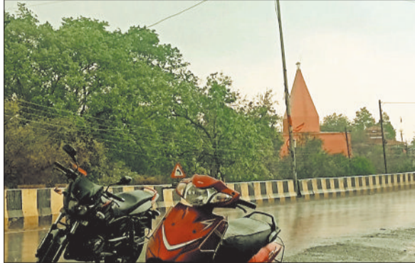
क्षेत्र में हो रही बारिश।

बैकुण्ठपुर/मनेन्द्रगढ़। क्षेत्र सहित पूरे जिले में मौसम ने अचानक करवट ले ली है। बोते चार दिनों से प्रतिदिन दोपहर बाद तेज आंधी, बिजली की चमक और झमाझम बारिश का सिलसिला जारी है, इससे आम जनजीवन अस्त-व्यस्त होता जा रहा है। इसके साथ ही तेज हवाओं के साथ हल्की बूढ़ाबांदी ने पूरे क्षेत्र को ठंडक का एहसास कराया। मुख्यालय सोनहत में देर शाम तक केवल हल्की बूढ़ाबांदी देखने को मिली, जबकि कैलाशपुर के जंगल क्षेत्रों से लेकर घुंरा, कटगोड़ी, शिवघाट सहित आसपास के ग्रामों में हल्की हो सका। एनएच 43 पर बड़ा पेड़ गिरने के बाद काफी देर तक चार पहिया वाहनों की आवाजाही बंद रही। मौसम विभाग के अनुसार यह